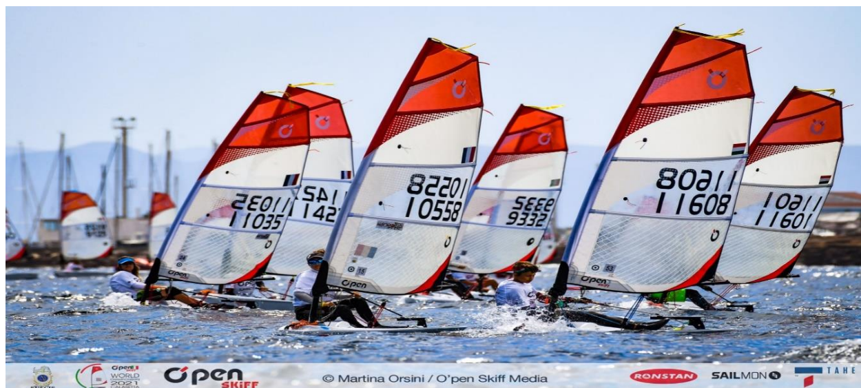
Championnat du monde openskiff 2022 Maubuisson